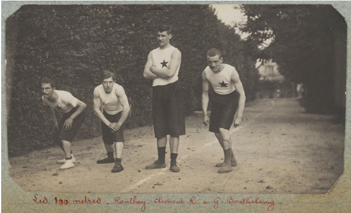
Archives du Loiret CL-DOC 6662, extrait de l'album coté 28 J 25